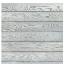
Play Oak Winter Plank