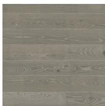
Play Oak Marble Plank