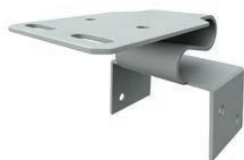
Lydbøyle 2 LB2, for feste til plant underlag i tak.