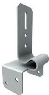
Lydbøyle 1 LB1, for feste til massive trebjelker.