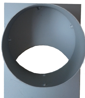
Filcoten® endevegg med stuss, fremside