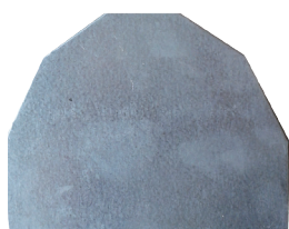
Filcoten® endevegg, tett